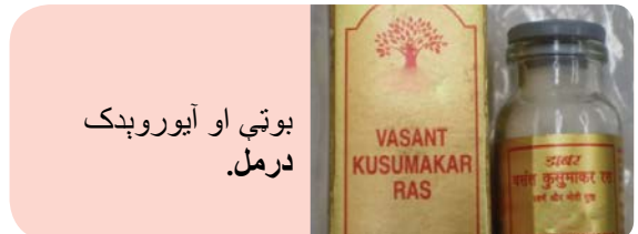
بوټي او آیوروډک درمل.